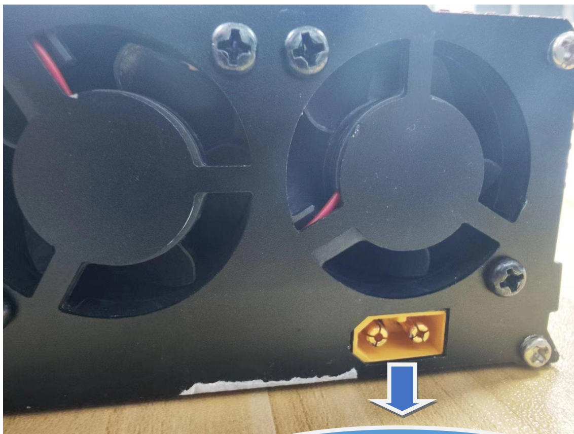
XT60 Input port 输入口